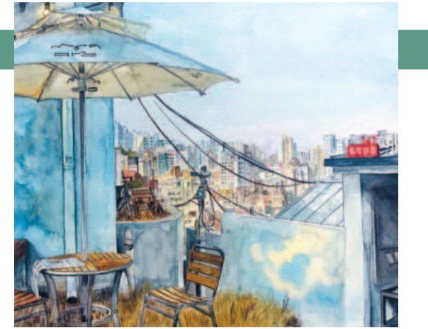
이양(한성대학교 회화과), <369>. (2023년 성북마을아카이브-한성대학교 예술학부 회화과 협업 프로젝트 작품)

김혜수 주연의 영화 <YMCA>에서 그 광경을 훌륭히 재현했습니다. 체육행사와 함께 시국 강연회도 열었는데 대개 그 내용은 대한제국의 자주독립을 위해선 몸과 마음을 강하게 길러야 한다는 것이었습니다. 도산 안창호의 삼선평 연설문이 《서북학회 월보》 1907년 6월호에 실려 있습니다. 시간이 흘러 삼선평이 들어간 노래도 만들었습니다. 바로 삼선초등학교의 예전 교가인데요, 1절 가사가 이렇습니다. “아침에 해 뜨고 밤에 달 뜨고 / 삼선평 넓은 들에 집들이 총총 / 집집이 자라나는 우리의 어린이는 / 한곳에 모여 사는 삼선 어린이” 예쁜 동요 같은 노랫말 속엔 우주의 섭리, 공존하는 마을과 학교, 자라나는 어린이들의 모습이 한 장의 그림처럼 담겨 있습니다. 기록을 살펴보니 삼선평은 사람들의 활달한 기