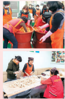
▲ 성북구 자원봉사자들의 활동모습

성북구자원봉사센터는 지역문제 해결을 위해 자원봉사자의 참여를 이끌어내고 자원봉사 활동처와 자원봉사자를 연결하여 효율적인 봉사활동이 이루어지도록 지원하는 자원봉사 전문기관입니다.