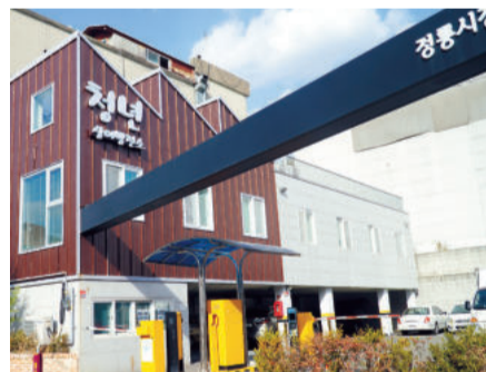
청년살이발전소 ☎ 02-919-8059