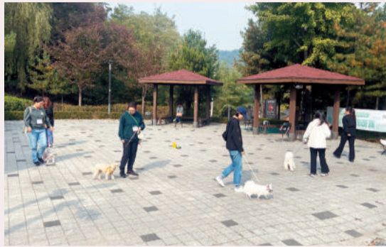
지역경제과 ☎ 02-2241-3933

지난 10월, 반려견 양육 가구를 위 한 산책교육 <슬기롭게 함께하게> 가 북악산 생태체험관에서 실시되었 다. 반려인과 비반려인 사이의 갈등 을 완화하고 행복한 반려 문화를 조 성하기 위해 올해 성북구에서 최초 로 마련된 교육이다. 관내 동물등록 을 마친 반려견 양육 가구 중 56팀이 신청, 총 24팀이 교육에 참여해 문제행동 교정을 하고 야외 산책코스를 돌아보는 시간을 가졌다. 산책 시 준수해야 할 패트켓과 올바른 산책 방법을 배운 참여자들 대부분은 만 족스러운 교육이었다고 평했다. 성북구는 내년에도 산책 교육을 확대하는 한편, 반려동 물에 대한 이해를 높일 수 있는 다양한 프로그램을 개발하여 반려동물과 평화롭게 공존 할 수 있는 반려 문화를 조성하는 데 적극 힘쓰겠다는 목표다.