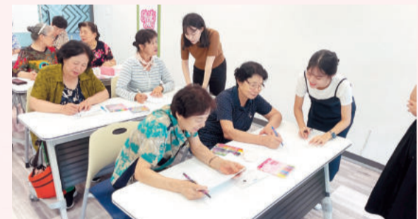
신종 피싱·스미싱 피해 방지 교육봉사

청년들이 본인의 전공과 재능을 바탕으로 기획하는 자원봉사 프로젝트 「청년만세, 청년(青年)이 만(萬)드는 세(世)상」이 2021년부터 올해까지 3년째 운영되었습니다. 대학생 자원봉사자들이 팀을 이루어 지역사회 이슈를 주제로 봉사활동을 기획 운영하였습니다. 보이스피싱 대처를 위한 교육부터 성북구의 숨겨진 문화유산을 알리는 체험형 역사문화 교육활동 등 구민들이 쉽고 재미있게 참여할 수 있는 봉사활동으로 구성했습니다.